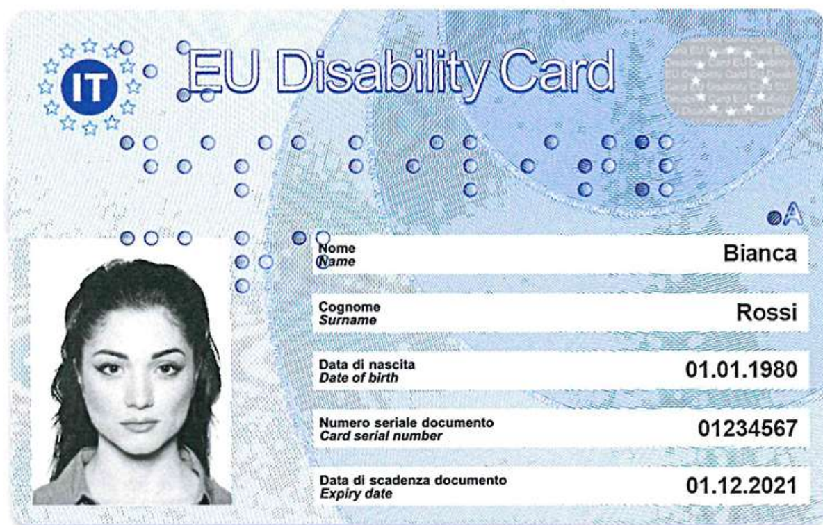
Recto con accompagnatore